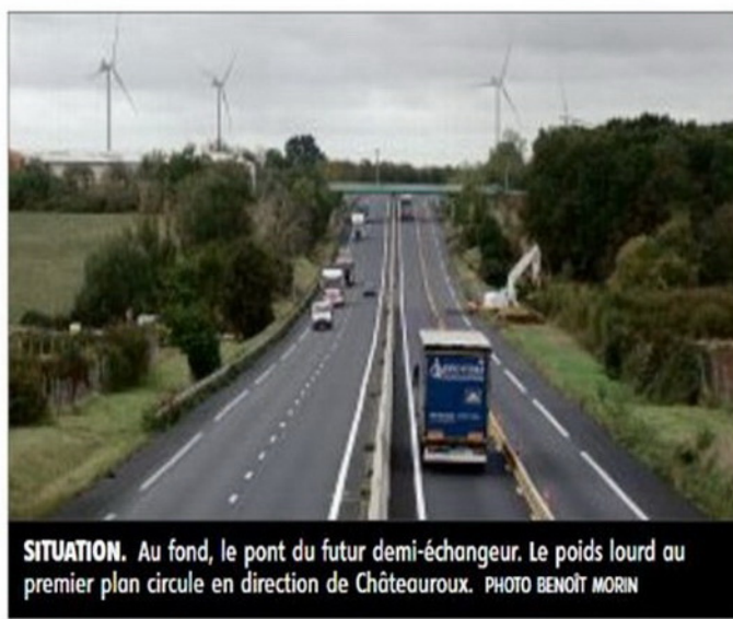
SITUATION. Au fond, le pont du futur demi-échangeur. Le poids lourd au premier plan circule en direction de Châteauroux.

■ 21 décembre 1990. Mise aux normes autoroutières de la déviation, qui prend le nom d'A20.